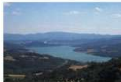
Lago di Montedoglio