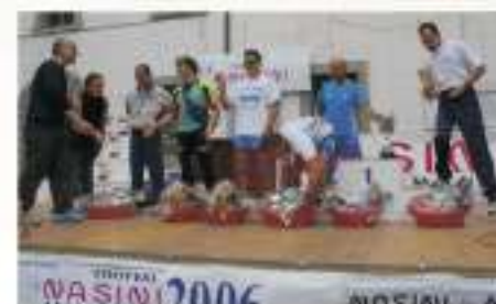
2006 PREMIAZIONI CATEGORIA ASSOLUTI