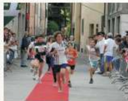
Categoria Maschile 1993 - 1994