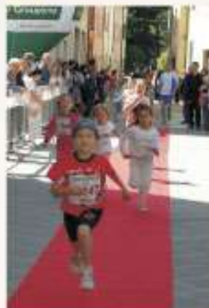
Categoria Femmine 1999 e seguenti

AI PRIMI 3 DI OGNI CATEGORIA COPPA MEDAGLIA A TUTTI I PARTECIPANTI