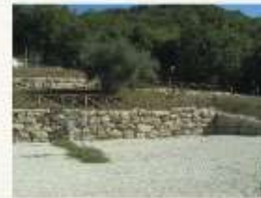
Pinzole "La Civetta"