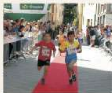
Categoria Maschile 1997 - 1998