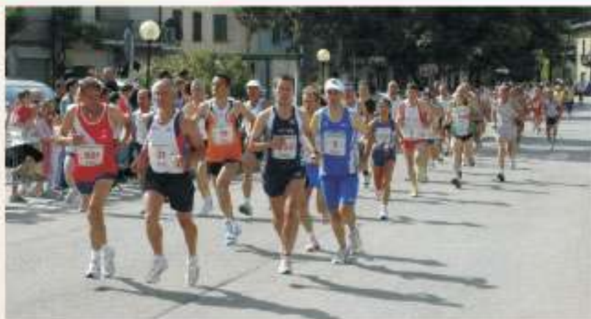
2006 - Passaggio nel centro di Pieve Santo Stefano