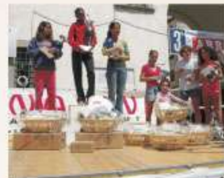
2006 PREMIAZIONI ASSOLUTI