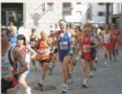
2006 Primo passaggio Centro Paese