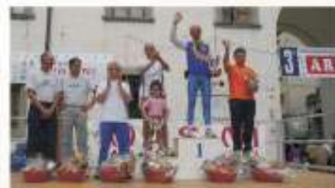
2006 PREMIAZIONI CATEGORIA ARGENTO