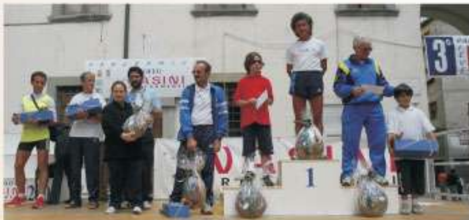
Premiazione Società 2006

Gli iscritti entro il 30 Maggio 2007 parteciperanno all'estrazione di: