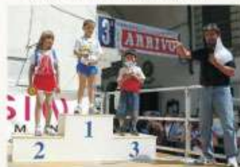
2006 ALCUNE PREMIAZIONI DELLE CATEGORIE GIOVANI