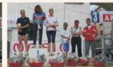
2006 PREMIAZIONI CATEGORIA DONNE