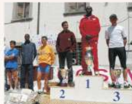
2006 PREMIAZIONI ASSOLUTI