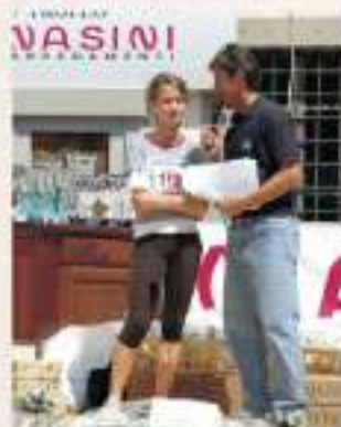
Categoria Maschile e Femmine 1989- 1990