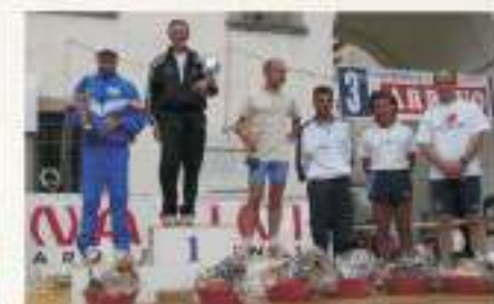
2006 PREMIAZIONI CATEGORIA VETERANI